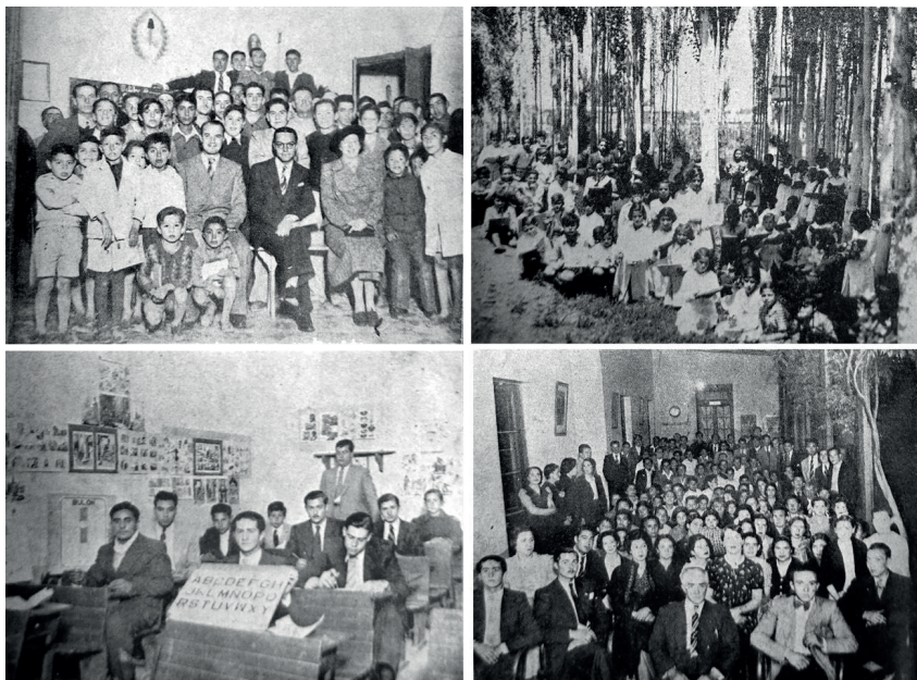
Figura 4. Escuelas municipales de Godoy Cruz