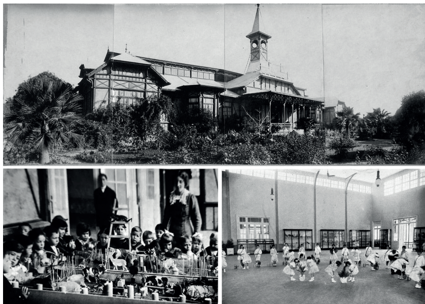
Figura 1. Edificio del Primer Kindergarten de Mendoza