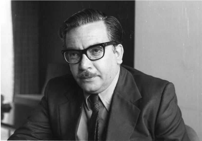
Figura 1. Luis González y González, ca. 1964.