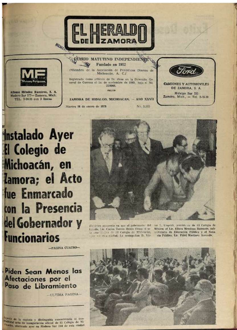
Figura 2. Ceremonia inaugural.