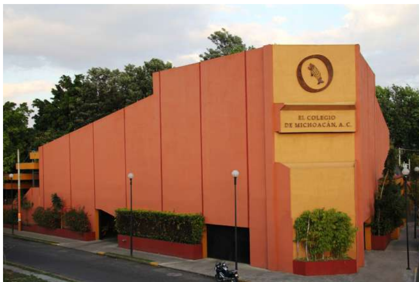
Figura 6. El Colegio de Michoacán.