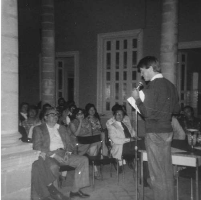
Figura 4. Conferencia Le Clézio.