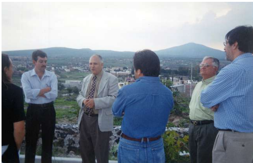
Figura 5. Lugar donde se edificó El Colegio de Michoacán, sede La Piedad.

En el 2004 comenzó a funcionar el Laboratorio de Análisis y Diagnóstico del Patrimonio (LADIPA), una instancia dedicada al estudio, análisis, diagnóstico y seguimiento científico y tecnológico del patrimonio natural y cultural material. El Observatorio Regional de las Migraciones surgió en el 2011, en el seno del Centro de Estudios Rurales; su objetivo es generar conocimiento, proponer y realizar proyectos de intervención, así como la difusión y divulgación del conocimiento sobre el fenómeno migratorio en y desde Michoacán.